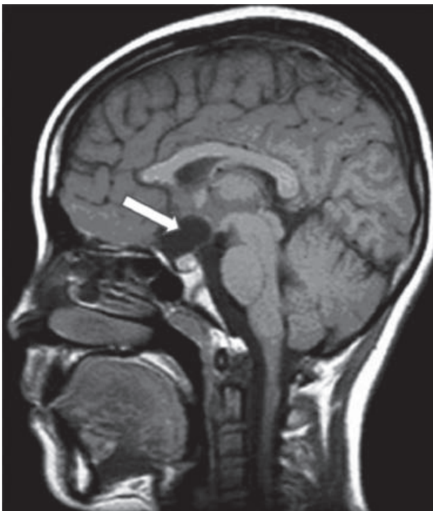
Figura 1. Imagen sagital T1 por resonancia magnética de cráneo donde se observa un quiste aracnoideo en la región supraselar que comprime el quiasma óptico.

Los quistes aracnoideos de la cisterna de Silvio se presentan con mayor frecuencia en hombres (3:1), con una localización predominante en el lado izquierdo. Clínicamente en los lactantes pueden producir una macrocrania asimétrica por abombamiento de la fosa temporal, fontanela tensa y retraso en el desarrollo psicomotor; en niños mayores el síntoma predominante es la cefalea (50%); 25% se manifiesta con crisis convulsivas, signos de hipertensión endocraneana o defecto motor focal cuando los quiste alcanzan grandes dimensiones. Una característica de los quistes aracnoideos silvianos es que pueden manifestarse con sangrado intraquístico o hacia el espacio subdural después de un traumatismo leve, atribuido a la existencia de vasos sanguíneos en la cápsula o en el interior del quiste que al no tener un soporte adecuado se hacen vulnerables a cualquier estiramiento o distensión. 23 Se han descrito rupturas espontáneas de los quistes con formación de higromas subdurales. 24